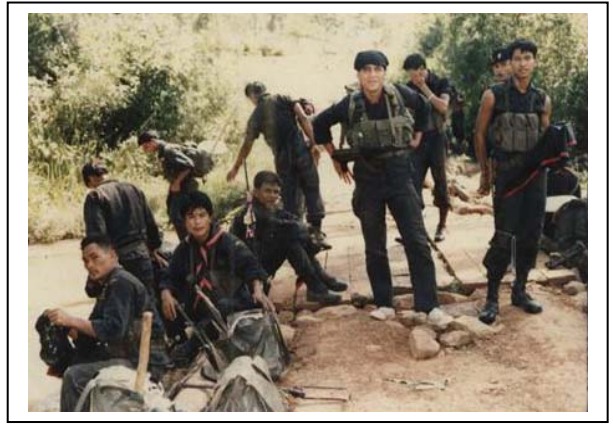
ม้าศึก 955 ที่ ช่องบก บ.แปดอู่ม อ.น้ำขุ่น จ.อุบลฯ ๑