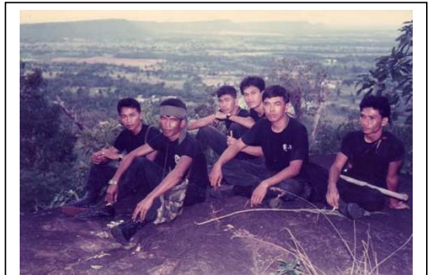
จนท. โครงส่วนฝึก ปี 2531 บนยอดภูหลวง ค่ายปັกธงชัย อ. ปັกธงชัย จ. นครราชสีมา