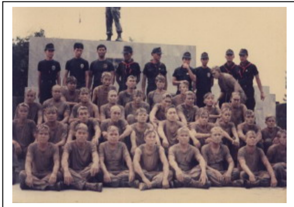
ฉากหนึ่งของทหารพรานจู่โจม ค่ายปึกธงชัย