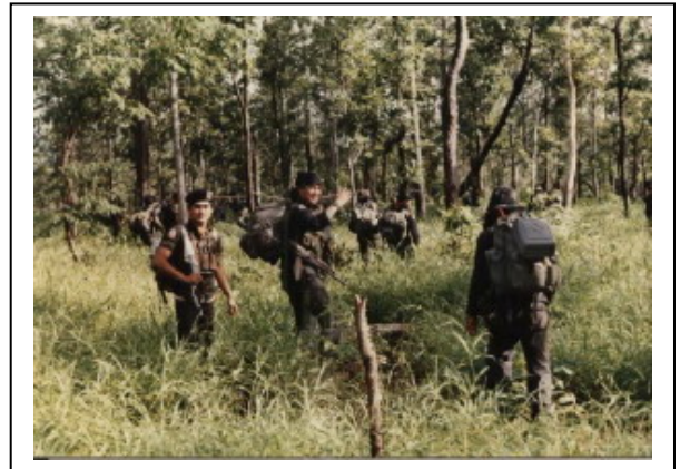
ร้อย.ม้าศึก ในแผนยุทธการจรยุทธ์ (ผีบ้า) พท. อ.ครบุรี – อ.วังน้ำเย็น 15 วัน 15 คืน